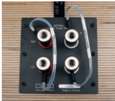
WBT:n liittimet täydentävät laadukkaan kokonaisuuden.