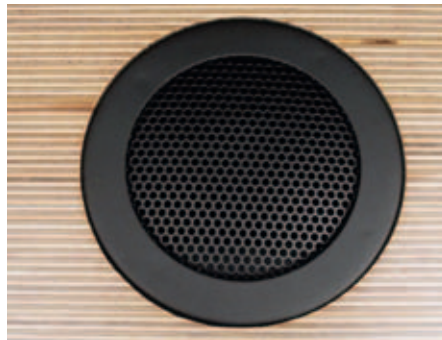
Refleksiputken edessä on ritilä.

Jakosuodin on erittäin huolellisesti koottu. Ylimääräiset värähtelyt on estetty komponenttien liimakiinnityksen avulla.